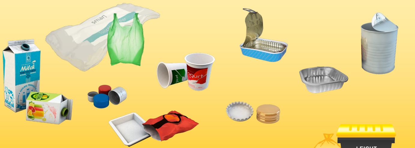
PLASTIC AND METAL PACKAGINGS