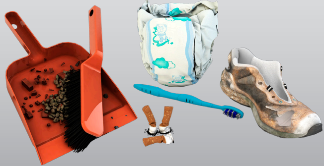
NON- RECYCABLE WASTE