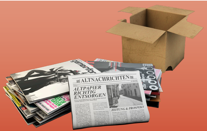
WASTE PAPER & CARDBOARD (PACKAGINGS)