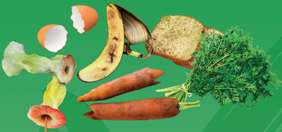
Obst- und Gemüseabfälle