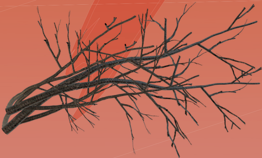
Strauchschnitt (Äste, Zweige)