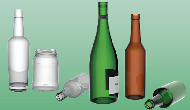
БІЛЕСКЛО, ТЕМНЕ СКЛО