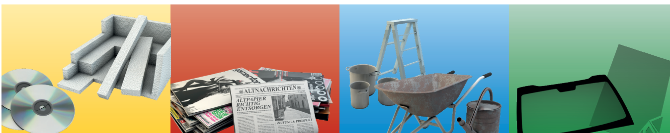
ПІНОПЛАСТ CD, ПВХ