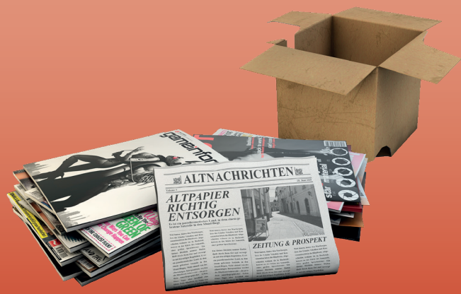
МАКУЛАТУРА ТА КАРТОН