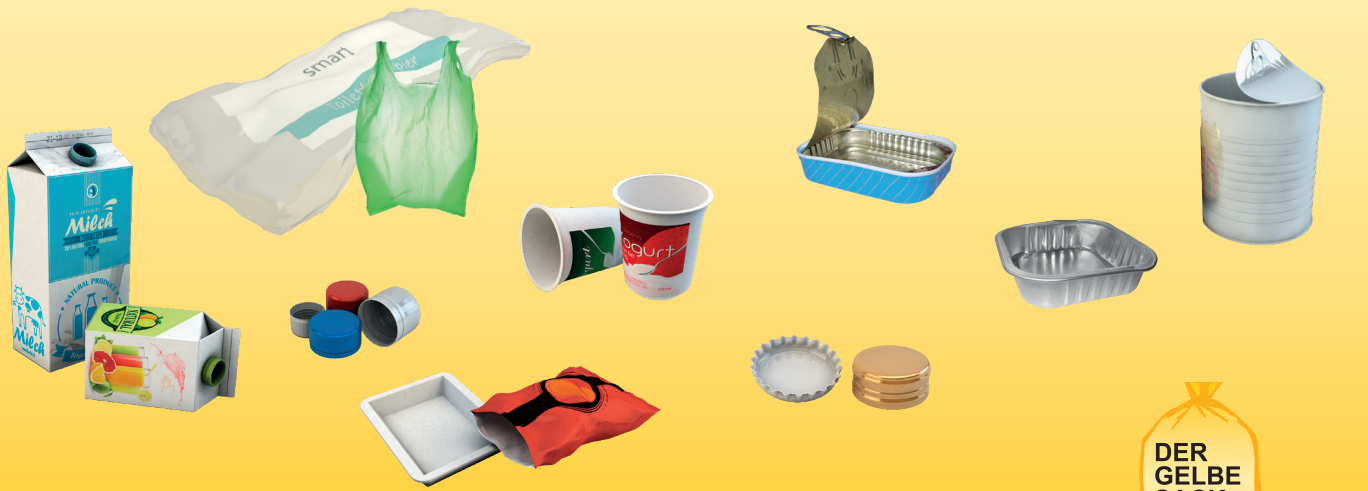
ПЛАСТИКОВІ УПАКОВКИ МЕТАЛЕВІ УПАКОВКИ